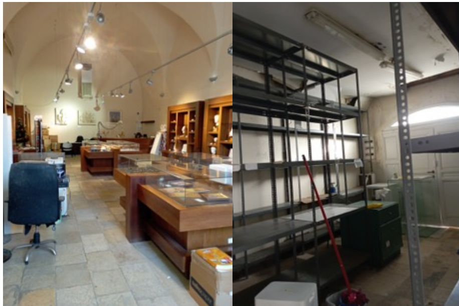
Η κάτοψη του πωλητηρίου